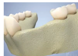
Volume osseux faible

Pour que cette période de cicatrisation se déroule dans les meilleures conditions, une prescription et des conseils post-opératoires, à suivre « à la lettre », vous sont remis par votre praticien.