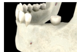
Incorporation de la greffe